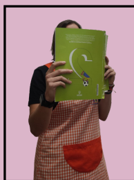
Annabel Mestra d'infantil i primària