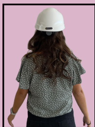
Marta Enginyera d'edificació

El setembre de 2021 tenia lloc la primera reunió oficial de Construïm Junes a Sabadell. D'aquell moment fins a la firma de l'acta fundacional i constitució de la junta definitiva, l'equip va anar canviant i va patir diverses baixes així com molt bones incorporacions.