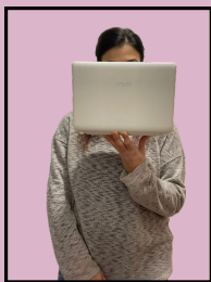
Aina Professora d'informàtica