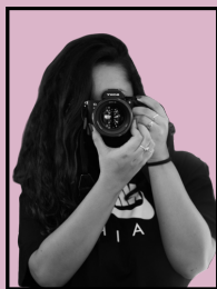
Carla Fotògrafa i videògrafa